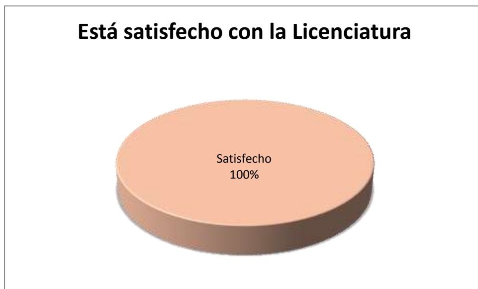
Figura 5.10.2 Satisfacción con la licenciatura

La figura 5.10.2 muestra que el 100% de los egresados encuestados estuvo satisfecho con la Licenciatura en Antropología Social.