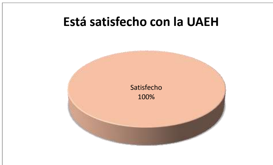
Figura 5.10.1 Satisfacción con la institución

La figura 5.10.1 muestra que el 100% de los egresados encuestados quedó satisfecho con la UAEH.