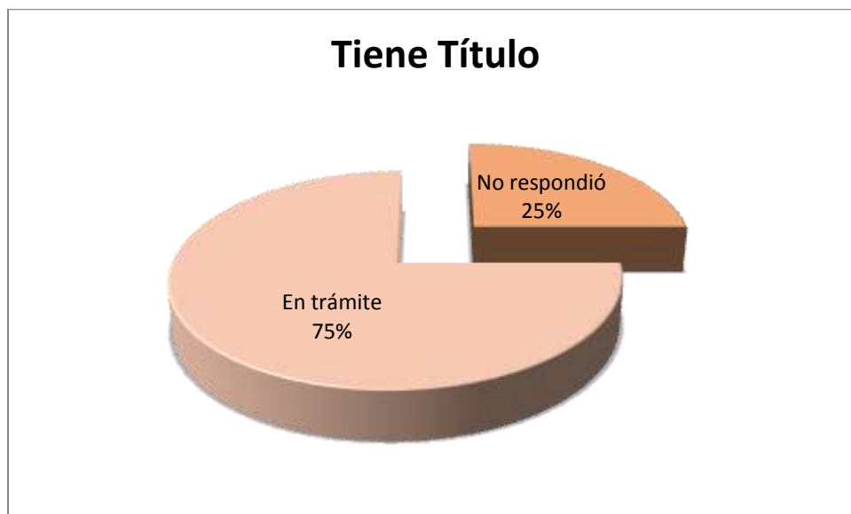
Figura 5.3.1 Título

Como se aprecia en la figura 5.3.1, respecto al índice de titulación de los egresados, el 25% no respondió si cuenta con título y 75% indicó que se encuentra el título en trámite.