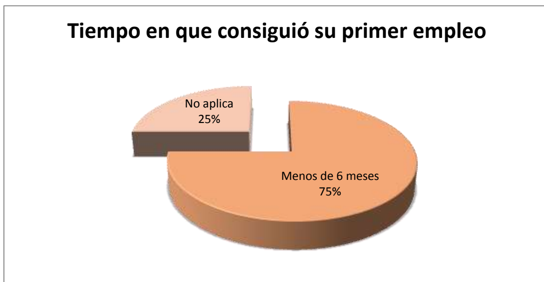
Figura 5.6.2 Tiempo en conseguir el primer empleo

De la proporción de egresados que consiguió empleo, el 75% lo halló en menos de 6 meses y para el 25% no aplica, lo cual se muestra en la figura 5.6.2.