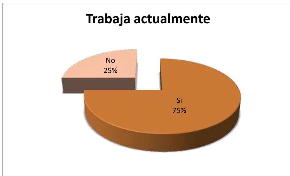
Figura 5.6.1 Trabaja actualmente

El 75% cuenta con trabajo actualmente y el 25% no trabaja (figura 5.6.1).